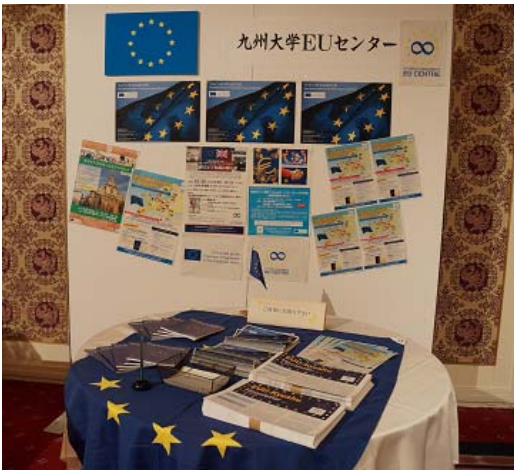
Kyushu University EU Centre's exhibition booth