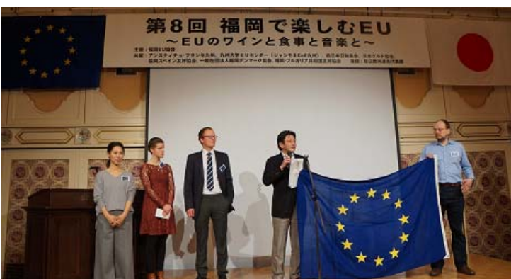
Participants from Kyushu University EU Centre introduced its activities