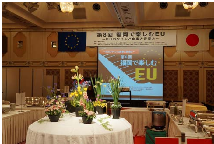
華やかな会場の様子