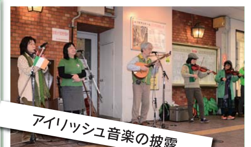
アイリッシュ音楽の披露

毎年3月17日のSt.パトリックス・デーは、アイルランドの守護聖人「聖パトリック」を讃える日としてアイルランドの国民的祝日になっています。現在では、アイルランド国内はもとより欧米各国や日本各地の主要都市でもパレードが開催されるようになりました。参加者はアイルランドのシンボルカラーである緑色の物を身につけてパレードをします。アイルランドではグリーンは希望と自然、そして春の訪れを表す色です。東京では1992年から、福岡では2014年から新天町商店街でスタートして以来、毎年開催いたしております。