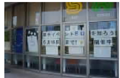
展示中のSALC外観 Outside of SALC during the exhibition