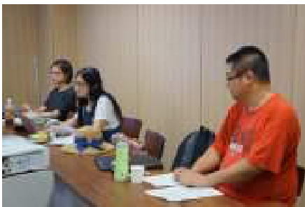
参加学生 / Participating Students

The seminar completed its programme with Advisor Hachiya's lecture on EU-Turkey relations, then by the students' proposals for the "Future of Europe" in light of each one's research interest. The participants found the seminar inspiring with suggestions for further research and expressed their wish for another opportunity for such a seminar. (By