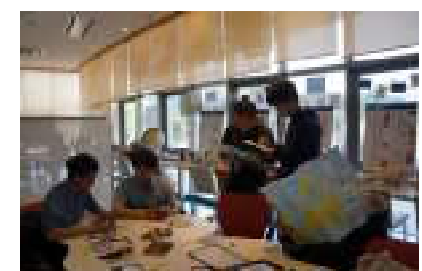
EUクイズを楽しむ学生 Students enjoyed the EU Quiz

In this event, with the full cooperation of the Self Access Learning Center (SALC), a special exhibition was held for about two weeks from Monday, May 29 to Friday, June 16. Exhibits included EU panels, EU-related books, and an introduction corner of the EU Studies Diploma Programmes, and more. Everyone who viewed the exhibition received the EU Centre special postcard. Numerous people visited the special exhibition booth at SALC and enjoyed it. Also, many people responded to the EU posting quizzes. Thank you very much.