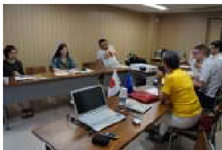
議論の様子 / Discussion