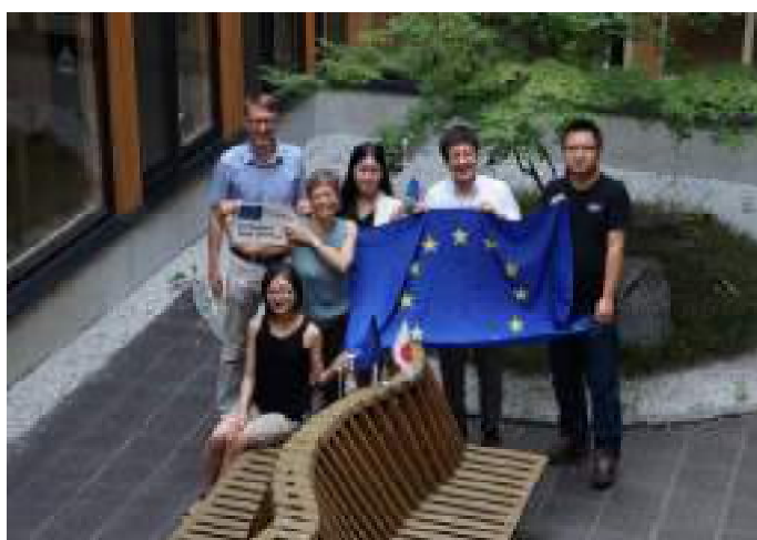
全参加者 / All participants

濃密なセミナーの楽しみは、食事です。伊都キャンパス名物のイタリア料理店ITORIITO、キャンパスから程遠くない海岸沿いにある魚料理の「ごうお」、そして学生食堂と様々な料理を、日本の風習や学生生活についてのおしゃべりを交えて楽しみました。