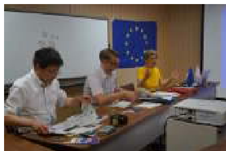
講師陣 / Lecturers