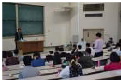
講義の様子 / Lecture