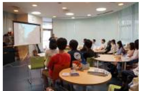
熱心に聴く参加者 / Participants listened intently

On Tuesday, 13 June 2017, from 16:40, an EU mini-lecture and a violin concerto were held at Ito Campus "Oumei Coffee House" as one of the special events of the Japan-EU Friendship Week.