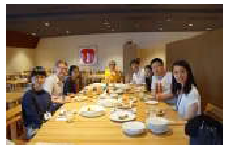
ウェルカムディナー / Welcome dinner