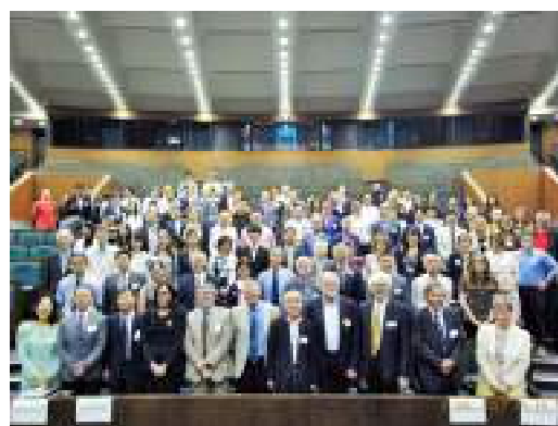
全参加者 会場の青山学院大学にて All Participants at Aoyama Gakuin University

Pacific region. The EUSA-AP Annual Conference is an international conference held every year at a rotating host country for presenting and exchanging research results on EU Studies. The 2017 conference was held at Aoyama Gakuin University in Tokyo on 1-2 July with more than 130 participants coming from as many as 30 different countries, not only limited to the Asia-Pacific region, but also from Europe and North America. JMCoE-Q supported the sessions for the graduate students on the second day of the programme. A total of 19 students participated in four sessions presenting their ongoing research. For some participants, it was the first time to present their research at an international conference. Although the presentation time was limited, students appreciated the comments and questions from the chairing professors as well as the floor. (Alternative to the JMCoE-Q EU Studies Residential Summer Course 2017) (By Machiko Hachiya)