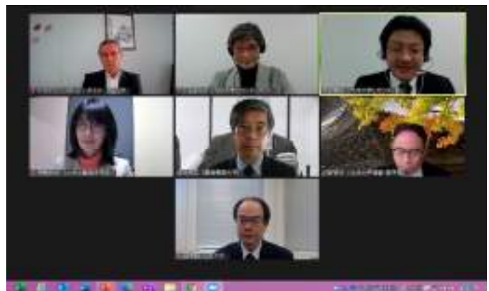
ウェビナーの様子（全登壇者） / The webinar (All speakers)

This symposium was held online as a webinar in the midst of the coronavirus pandemic, and the kick-off event was a great success with the participation of approximately 70 people from all over the country.