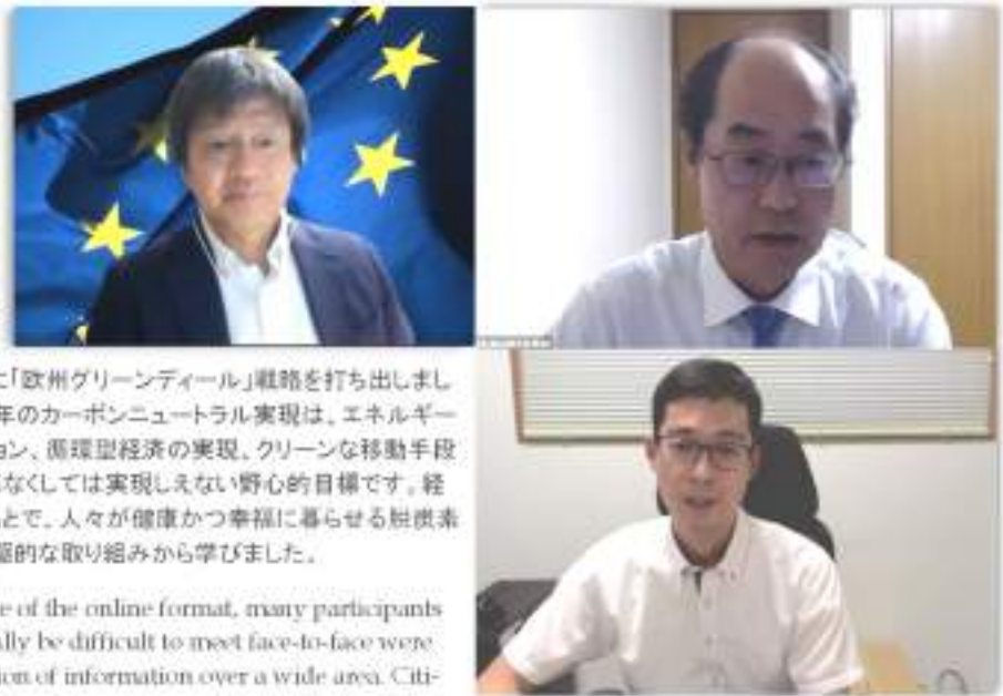
(左上)岩田健治氏、(右上)蓮見雄氏、(下)分山達也氏 / (Upper left) Prof. Kenji Iwata, (Upper right) Prof. Yu Hasumi, (Bottom) Assoc. Prof. Tatsuya Wakeyama

The realization of carbon neutrality by 2050, which this strategy advocates as an environmental policy, is an ambitious goal that cannot be achieved without structural economic and social changes, such as decarbonization of the energy sector, innovation in the industrial sector, the realization of a circular economy, and the shift to clean transportation. We have learned from the pioneering efforts of the European Green Deal to aim for a carbon-free society where people can live in good health and happiness under a new growth trajectory through economic and social reforms.